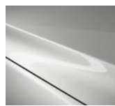
A4D Arctic White