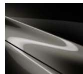
42S Titanium Flash