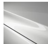
25D Snowflake White Pearl