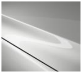
A4D Arctic White