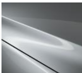
45P Sonic Silver