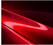
46V Soul Red Crystal