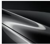
46G Machine Gray