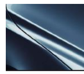
45B Eternal Blue Metallic