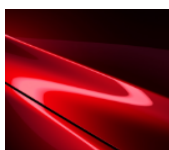
46V Soul Red Crystal