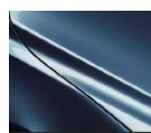
45B Eternal Blue Metallic