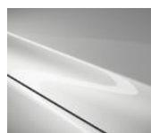
25D Snowflake White Pearl