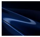
42M Deep Crystal Blue