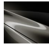
42S Titanium Flash