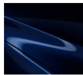
42M Deep Crystal Blue