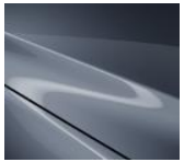
47C Polymetal Gray