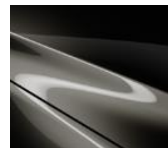
42S Titanium Flash