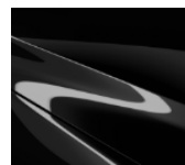
41W Jet Black