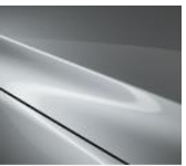
45P Sonic Silver