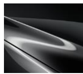
46G Machine Gray