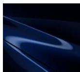
42M Deep Crystal Blue