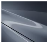
47C Polymetal Gray (Vain Hatchback)