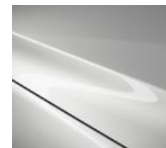
25D Snowflake White Pearl