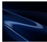
42M Deep Crystal Blue