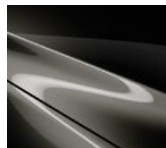
42S Titanium Flash