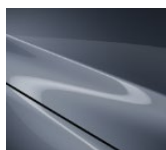
47C Polymetal Gray (tikai hečbeka modeļiem)