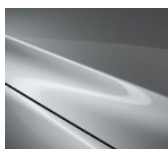
45P Sonic Silver