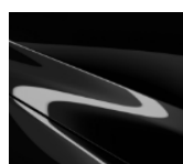
41W Jet Black