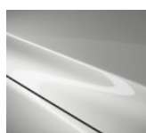
A4D Arctic White