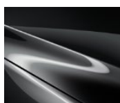
46G Machine Gray