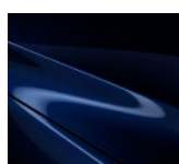
42M Deep Chrystal Blue