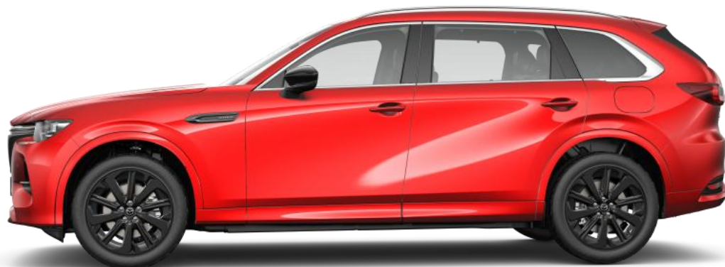
20" Black Alumiinivanteet (235/50R20)