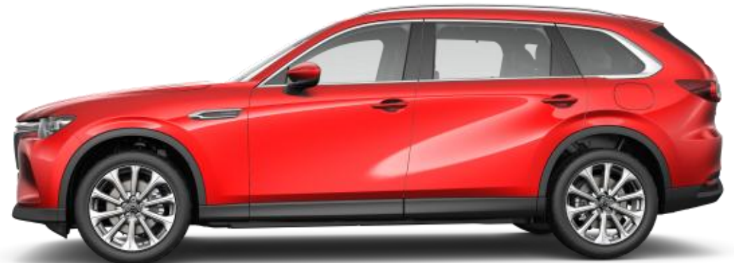
20" Bright Alumiinivanteet (235/50R20)