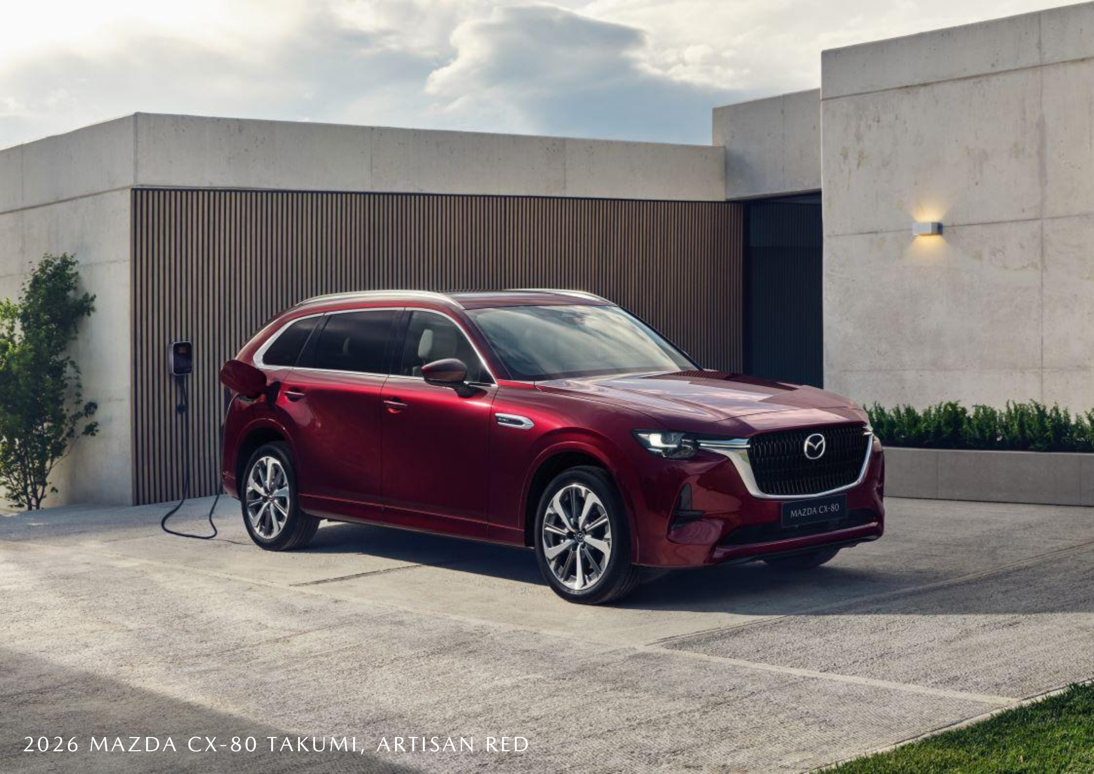
2026 MAZDA CX-80 TAKUMI, ARTISAN RED