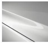
25D Snowflake White Pearl