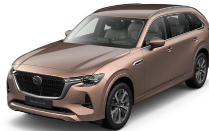
52H Melting Copper