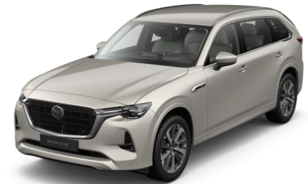
47S Platinum Quartz