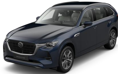
42M Deep Crystal Blue