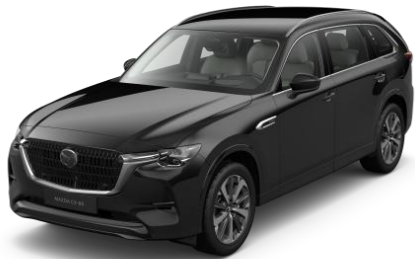
41W Jet Black