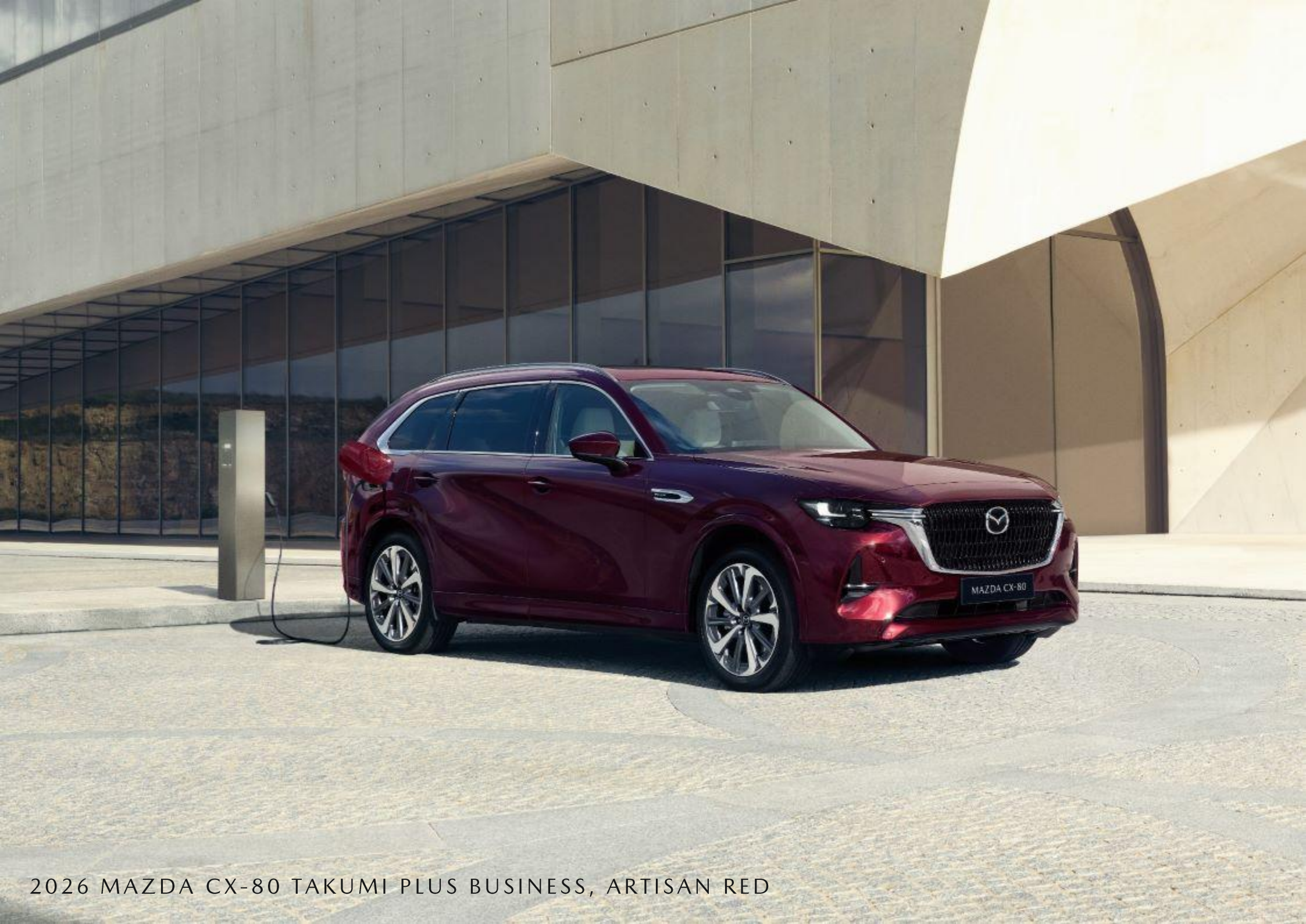
2026 MAZDA CX-80 TAKUMI PLUS BUSINESS, ARTISAN RED