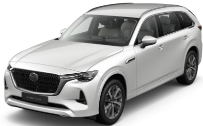
51K Rhodium White