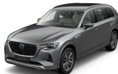
46G Machine Grey