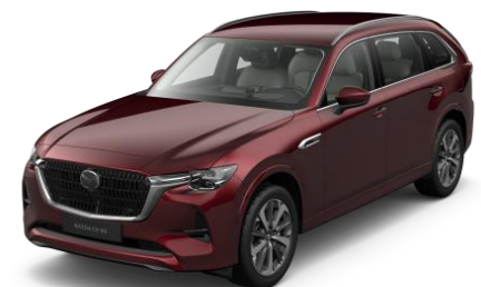
51F Artisan Red