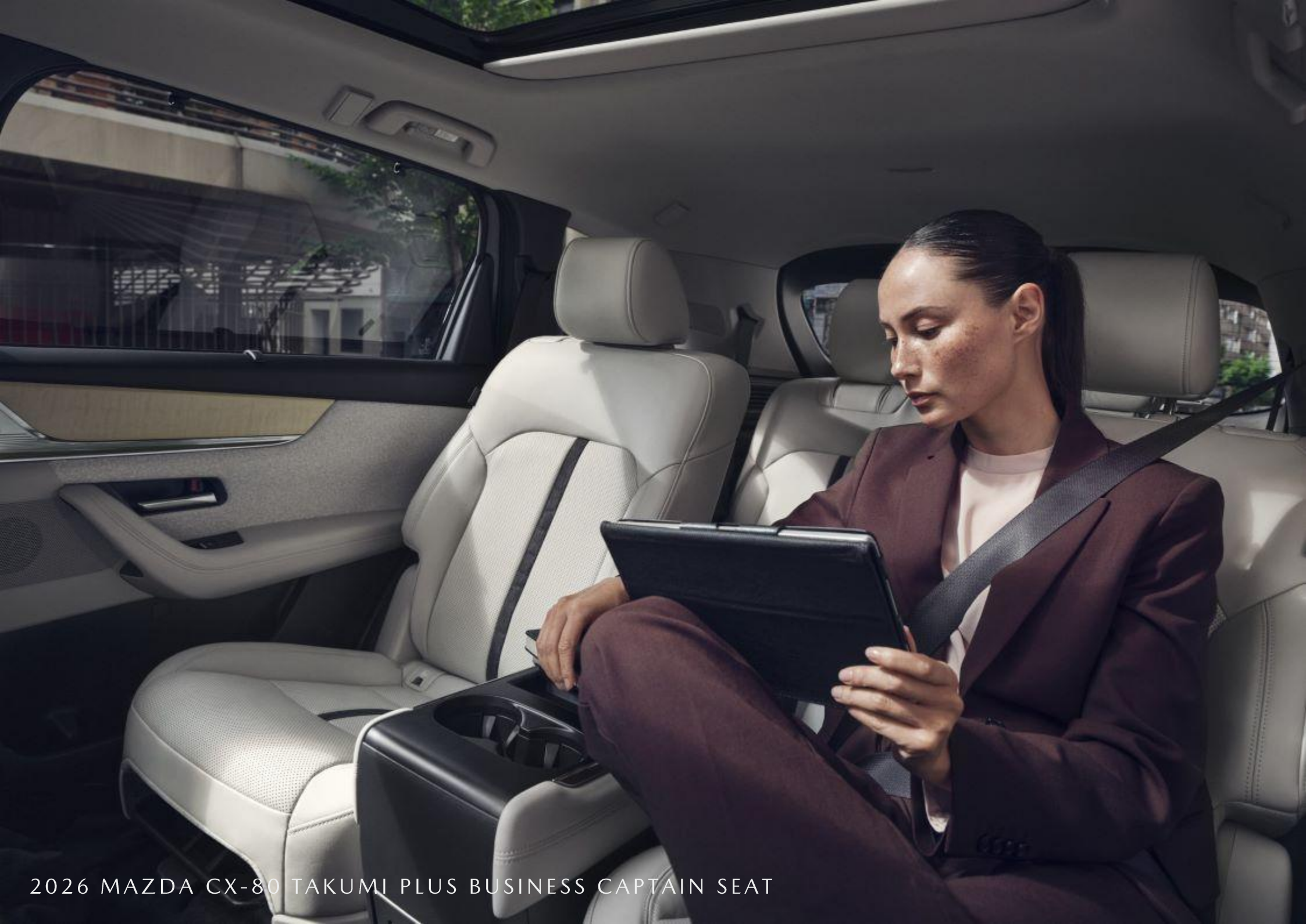
2026 MAZDA CX-80 TAKUMI PLUS BUSINESS CAPTAIN SEAT