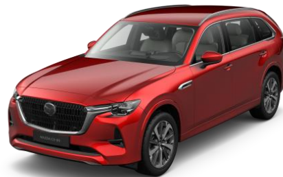
46V Soul Red Crystal